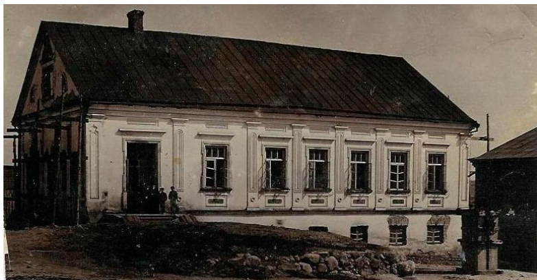
ישיבת וולוז'ין - אם הישיבות, בית גידולם של רבים מגדולי ישראל

ובשולי הדברים ניתן עוד לומר, שאפשר לראות בהעמדת ארון הקודש של ה'נחלת דוד' ב"כותל המזרח" בבית המדרש במכון מאיר, משום הצבת "יד ושם" לדור הנפילים מקימי עולה של תורה בישיבת וולוז'ין המעטירה, שמכוחם התחדש עולם התורה עד שחזר במלוא עוצמתו וגודלו לציון וירושלים.