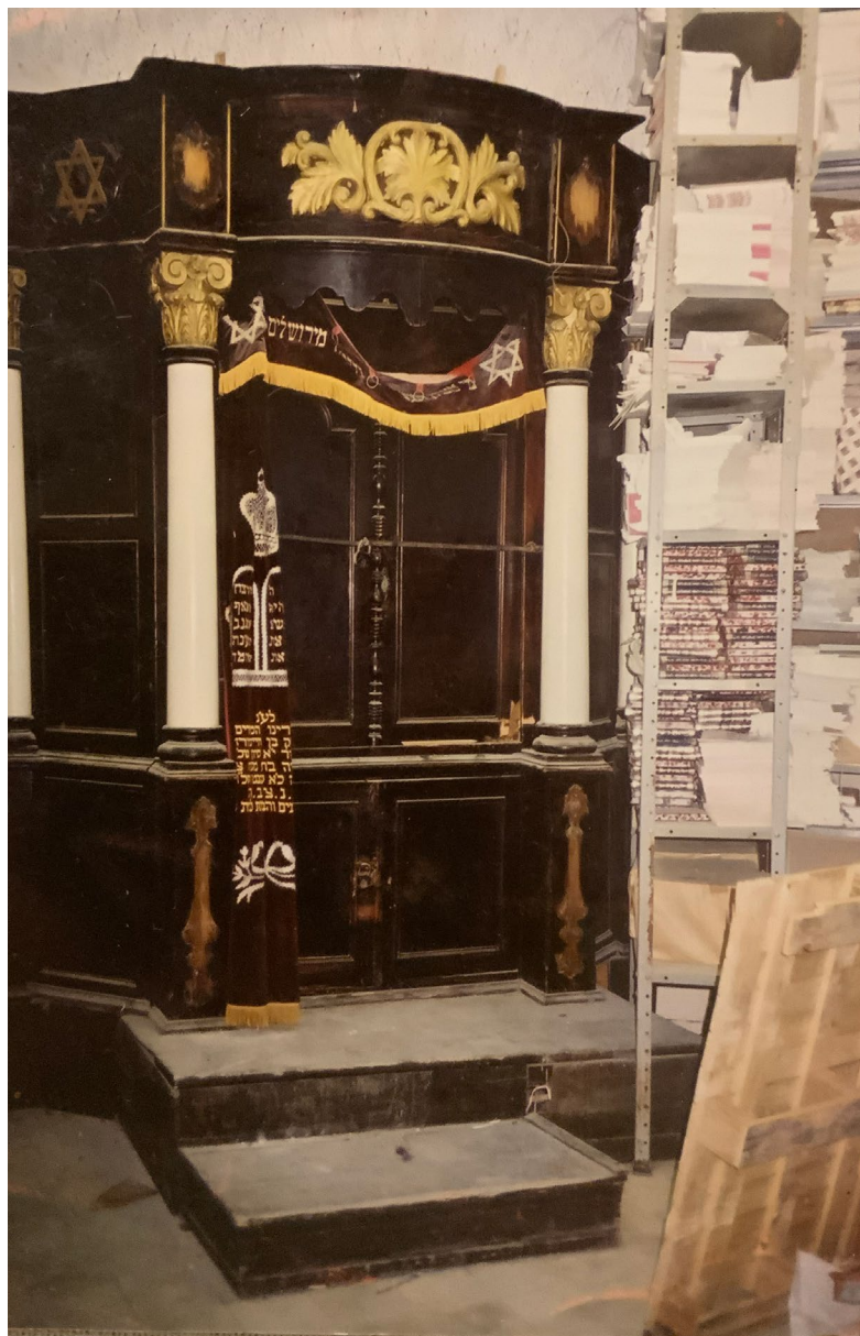
ארון הקודש מונח בקרן זווית מחכה לגאולתו