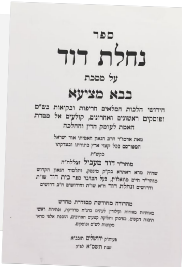
ספרי ר' דוד טביל במהדורות חדשות