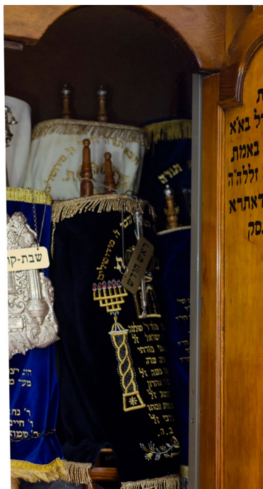
כל שנים עשר ספרי התורה מונחים בארון שבמקורו החזיק ארבעה ספרים בלבד