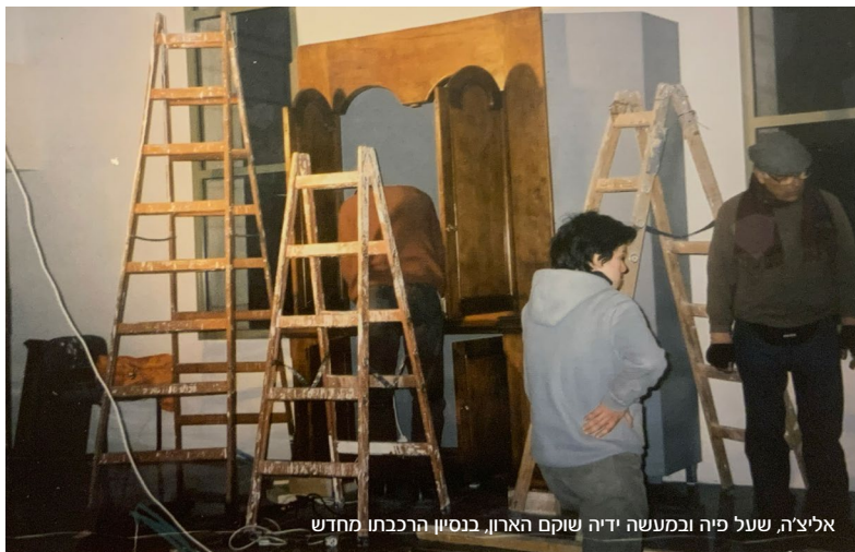
אליצ'ה, שעל פיה ובמעשה ידיה שוקם הארון, בנסיון הרכבתו מחדש