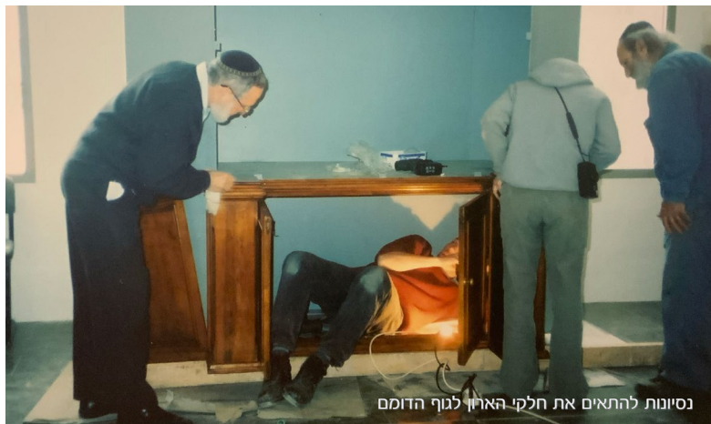
ניסיונות להתאים את חלקי הארון לגוף הדומם

ההתרגשות ניכרה בכול, כראוי ליום אליו הגענו, שבו למעשה אמורה להיבחן כל הדרך בה צעדנו ב"דחילו ורחימו", ושאנו כה מצפים לראות בסופה את פירות המאמץ.